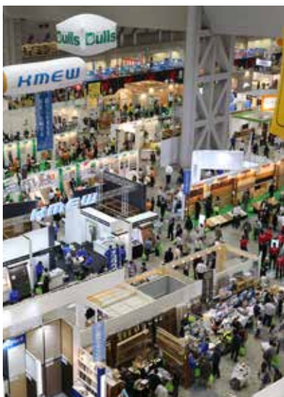
第31届 Japan 建材博览会