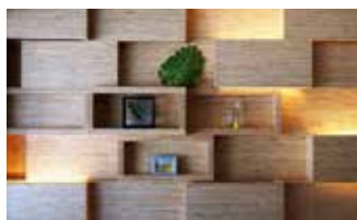
使用 LVL 胶合板内部装修的实例

总部所在地 东京都江东区新木场 1-7-22 新木场塔 8F 工厂 千叶县木更津市木材港 15 主页 http://www.key-tec.co.jp 代表 松田 一郎 (董事长) 资本金 268 百万日元 销售额 6,254 百万日元 (2013 年 3 月期) 员工人数 188 名 事业内容 各种胶合板, 建材用单板层积材的生产和销售