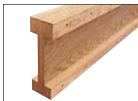
KEYLAM MEGABEAM 轴材