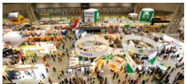
第33届 Japan 建材博览会

这是个超大型的展销会，每次参展厂商有 200 家，参观者两万四千人，销售额超过 400 亿日元。