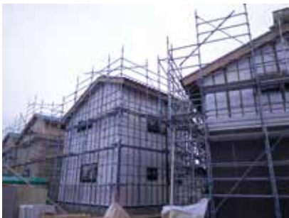
福岛县相马市荒田地区公营住宅

2012 年 4 月以来，累计参加 600 户以上灾区公营住宅建设 (木结构建筑)。