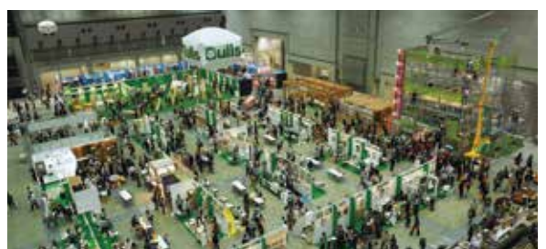
第35届 Japan 建材博览会

这是个超大型的展销会，每次参展厂商有 200 家，参观者两万四千人，销售额超过 400 亿日元。