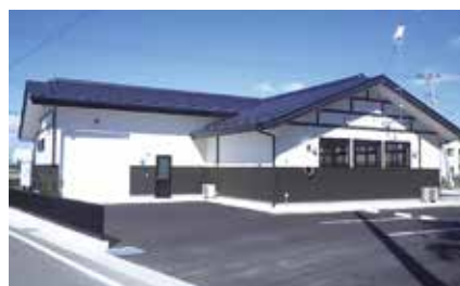
福岛县相马市住宅社区设施