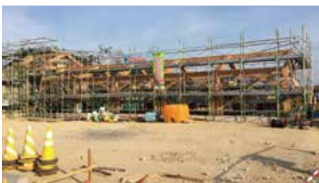
宫城县东松岛市“JR 仙石线·野蒜站前广场设施”

JK 集团一直在灾害公营住宅（木质结构）工程和购买材料方面做出了实际成果。参与了社区设施和站前广场设施等的公共设施，今后也将进一步扩大活动范围。